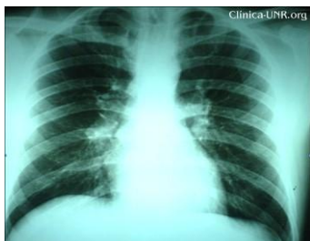
Índice cardiorádico conservado. Sin lesiones pleuroparenquimatosas. Fondos de saco libres.