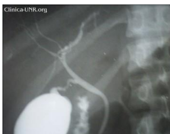
Sin dilatación de vía biliar. Sin obstrucción