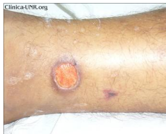
Lesiones ulceradas con fondo necrótico, de bordes sobreelevados, sin secreción, no dolorosas en ambos miembros inferiores.