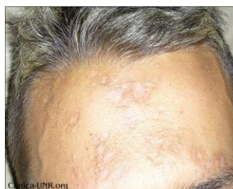
Lesiones hiperpigmentadas en la frente.